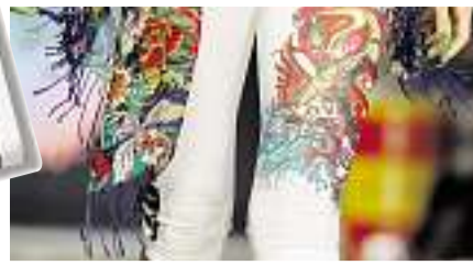
SCHRILLE TATTOO-MODE VON ED HARDY

An der Modenschau bei der Mercedes-Benz Fashion Week im kalifornischen Culver City.