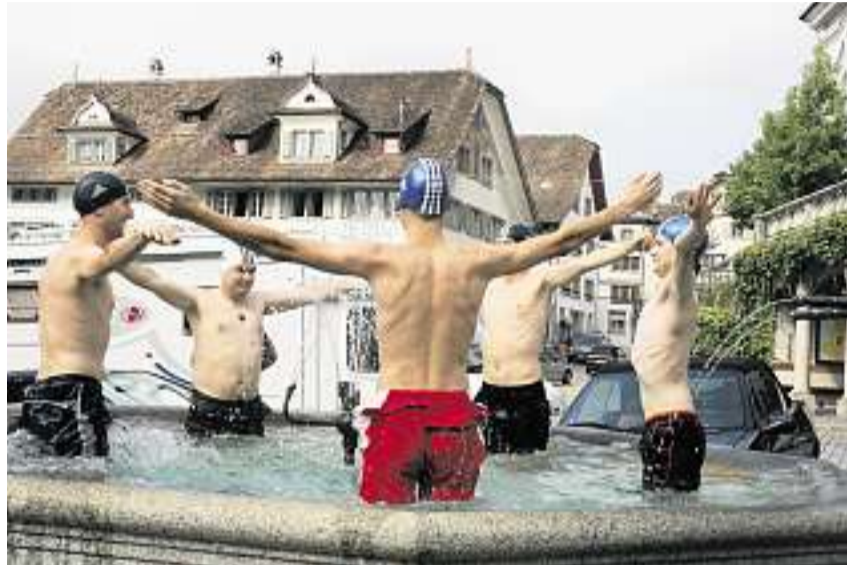
Synchronschwimmen im Schwyzer Dorfbrunnen: Fünf Schwyzer Freunde setzen die erste «Furzidee» um.

Erste Aktion als Touristenattraktion «Synchronschwimmen im Schwyzer Dorfbrunnen» hiess die erste Furzidee, die vor Kurzem auch in die Tat umgesetzt wurde. Bei 12 Grad Celsius wagten sich die Herren an den Frauensport und absolvierten ihre Übungen Tenükonform mit Badehose und Badekappe. «Da die Aktion an ei-